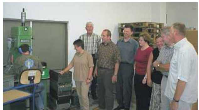
Vertreter der ISO-Gesellschafter beim Firmenrundgang